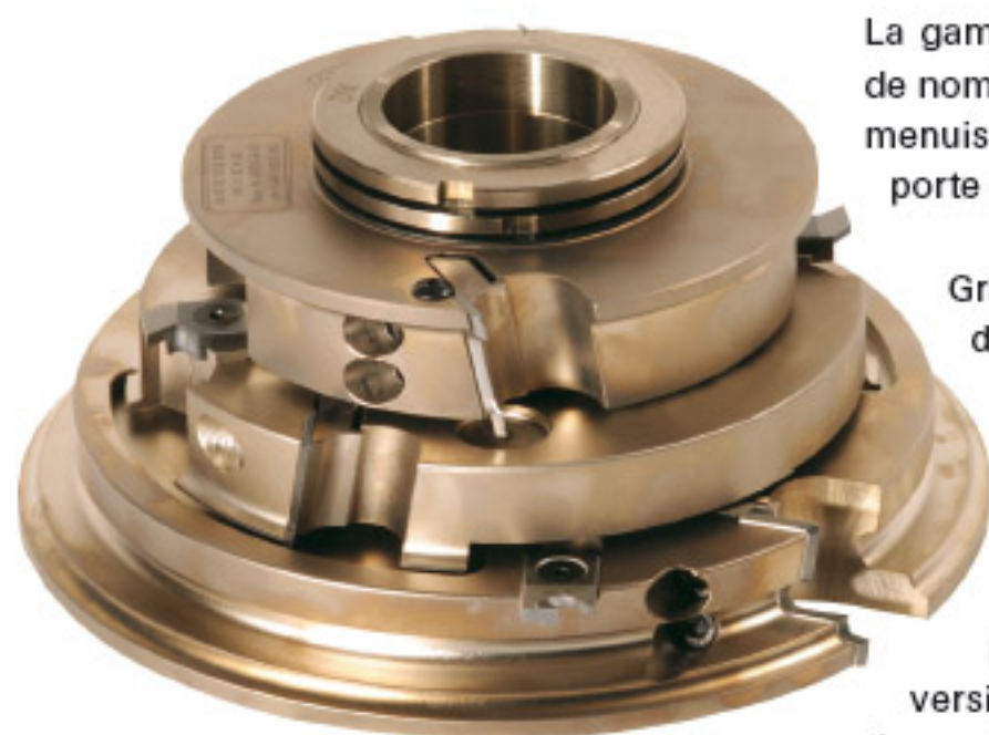
Jeu d'outils à plaquettes profils

La gamme des outils LEUCO englobe depuis de nombreuses années, un choix d'outils pour menuiseries, que ce soit pour le domaine de la porte ou de la fenêtre.