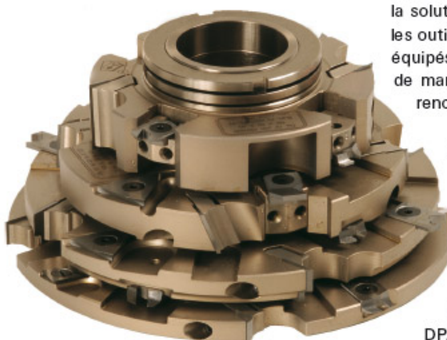
Version à plaquettes standards

Grâce à une importante capacité d'innovation, LEUCO est votre partenaire incontournable pour la fourniture d'outillage de grandes performances pour fenêtres et portes en bois, bois-alu, PVC ou aluminium. Ces outils sont fabriqués selon les profils que vous nous soumettez en version à plaquettes brasées dans le cas de productions de petites séries, à plaquettes carbures amovibles, ou en diamant.